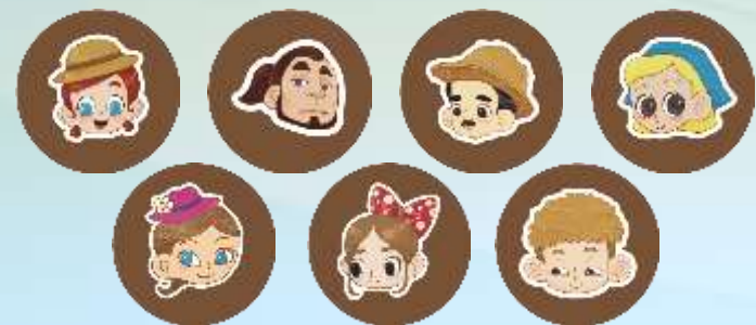
角色整治物*56 每個角色各8個