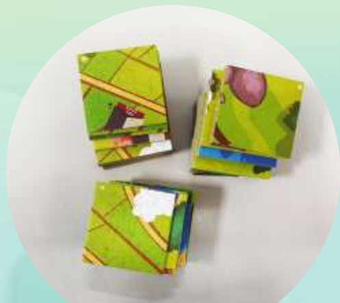
土地底圖*49 右下角標示數字編號